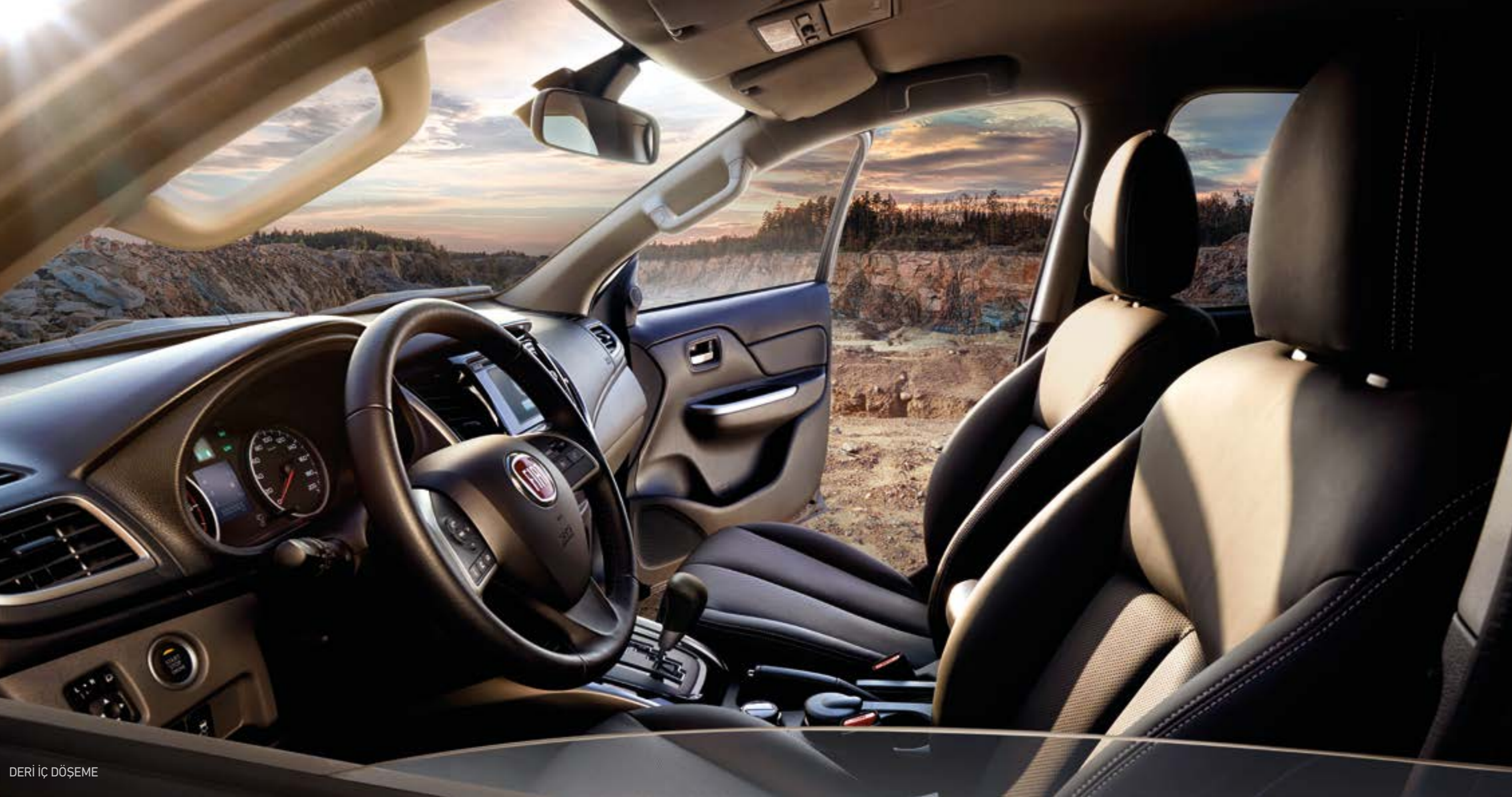
DERİ İÇ DÖŞEME

Bunun yanında 6,8 inç dokunmatik ekranlı mirror link, Wi-fi/internet erişimli, navigasyonlu multimedya sistemi Fullback'in üstün özelliklerinden sadece bazıları.