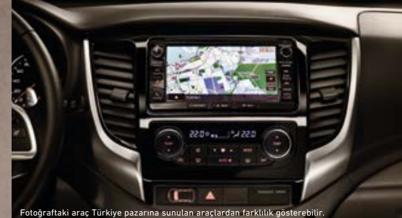
Fotoğraftaki araç Türkiye pazarına sunulan araçlardan farklılık gösterebilir.