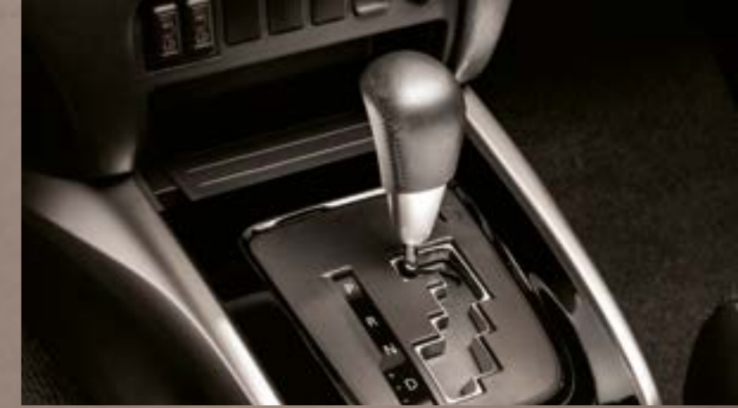
5 İLERİ OTOMATİK ŞANZİMAN