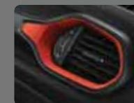
Kırmızı Dikişli Siyah Kumaş (149) Yakut Kırmızı Çerçevesler