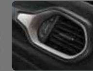
Siyah Deri (506) Parlak Gümüş Çerçevesler