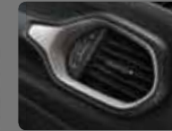
Siyah Kumaş (105) Parlak Gümüş Çerçevesler