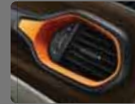
Buz Gri/Kahverengi Deri (513) Turuncu Çerçevesler