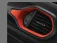
Kırmızı Dikişli Siyah Deri (515) Yakut Kırmızı Çerçevesler