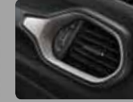
Siyah Kumaş (101) Parlak Gümüş Çerçevesler