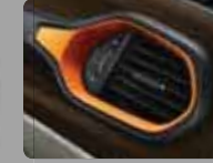
Buz Gri/Kahverengi Kumaş (134) Turuncu Çerçevesler